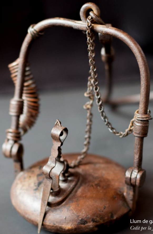
Llum de gall