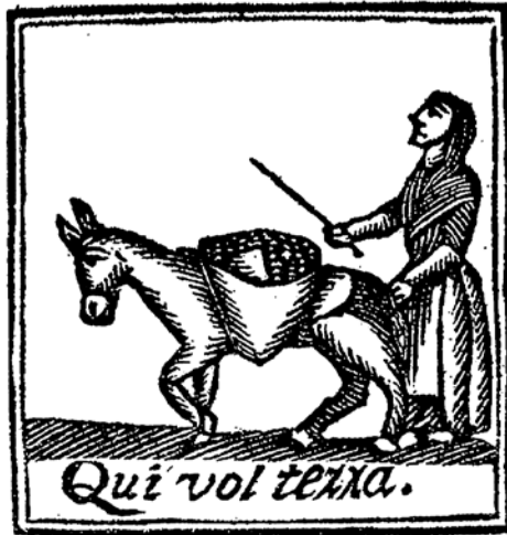
Auca del segle XVIII.

● Un altre aspecte molt rellevant era el de les comunicacions, ja que es tractava del principal condicionant per la tasca que realitzaven les bèsties de càrrega. Durant bona part de la història del nostre país, els camins de bast, que només permetien la utilització de rucs i mules sense carro, van ser els més habituals, especialment a les zones muntanyoses. La millora d'aquesta xarxa de camins, mitjançant la construcció de ponts i de camins carreters, va permetre fer el salt qualitatiu: poder fer servir carruatges que permetessin incrementar enormement la càrrega transportada (Serra, 2008).