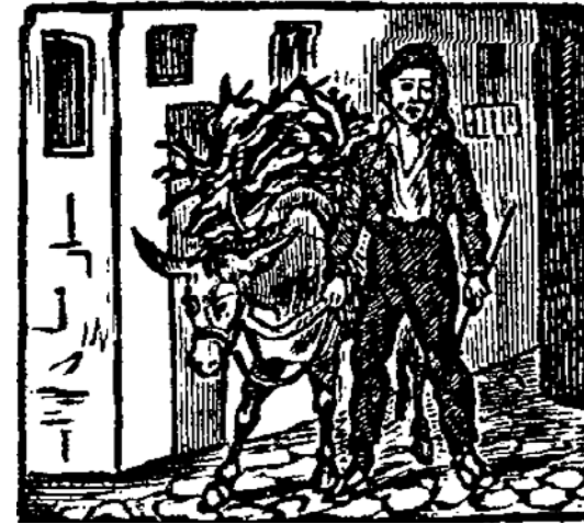
Auca del segle XIX.

La mecanització del camp, juntament amb l'aparició massiva de vehicles de motor i l'èxode rural van convertir l'animal de bast en un animal obsolet, que es va utilitzar només per l'explotació patrimonial, folklòrica i turística. Cal recordar que, des d'un punt de vista econòmic, en el seu moment, la bèstia de càrrega va ser un animal domesticat amb l'únic objectiu de ser explotat pels humans. En les condicions de la societat agrària, doncs, aquest animal era una forma de capital. Així, és ben normal que a ulls de la mirada occidental urbana, l'animal de bast s'associï a una vida camperola ja superada que s'acostuma a interpretar des d'un punt de vista nostàlgic o bé des d'una inferioritat evolutiva.