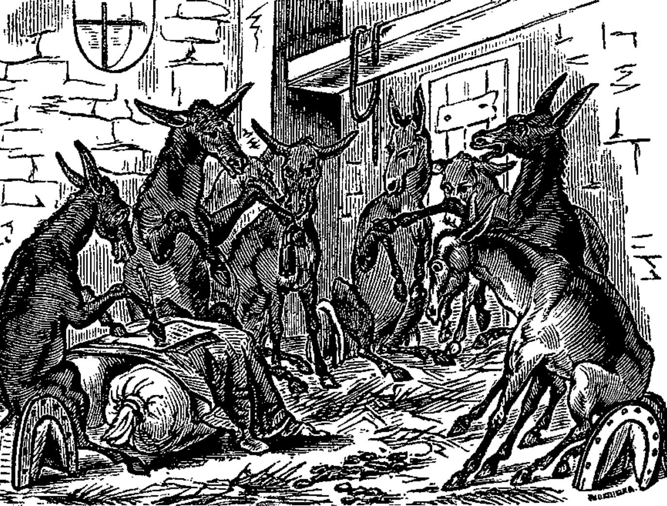
Representació del congrés dels ases, govern paròdic en el qual els ases es convertien en els animals més savis de tots durant la Nit de Nadal com a il·lustració popular burlesca de l'ús simbòlic d'aquesta bèstia (Amades, 1950, I: 103).

● L'ase ha estat associat a pecats capitals alhora que s'ha reivindicat com a animal seleccionat per Crist, per la seva docilitat i humilitat. Ha estat cavalcats per bruixes i ha servit com a representació del mateix Anticrist, però també ha servit de muntura per a l'entrada de Jesús a Jerusalem. Ha sigut, en definitiva, el símbol de la follia, de la depravació, de l'heretgia i del dimoni; però també del sacrifici, de la humilitat i del pacifisme (Del Campo, 2012). Una visió que, en certa manera, es podria resumir en la dicotomia universal entre el bé i el mal, una concepció d'oposicions binàries del món que, per a alguns estructuralistes com Lévi-Strauss, és la classificació que dona sentit a la nostra forma d'entendre la realitat.