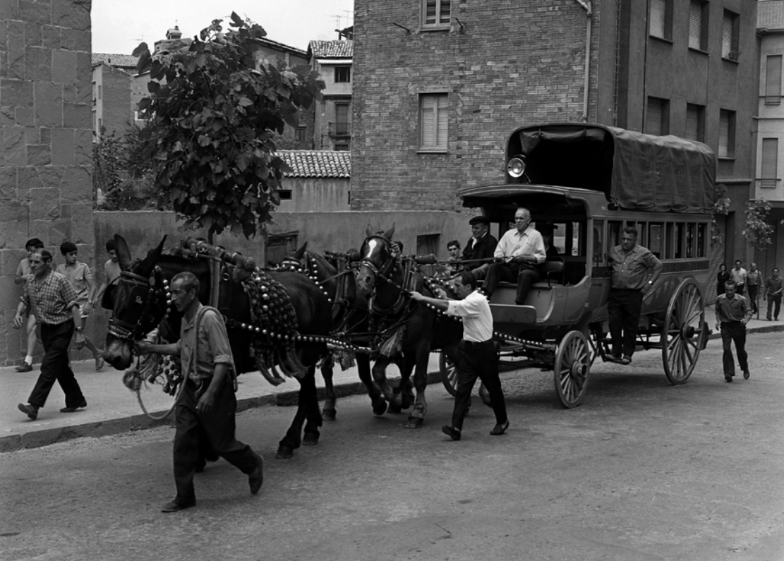
La mobilitat de les poblacions humanes aconseguida gràcies a la domesticació de cavalls i ases va suposar una de les primeres grans transformacions de la història.