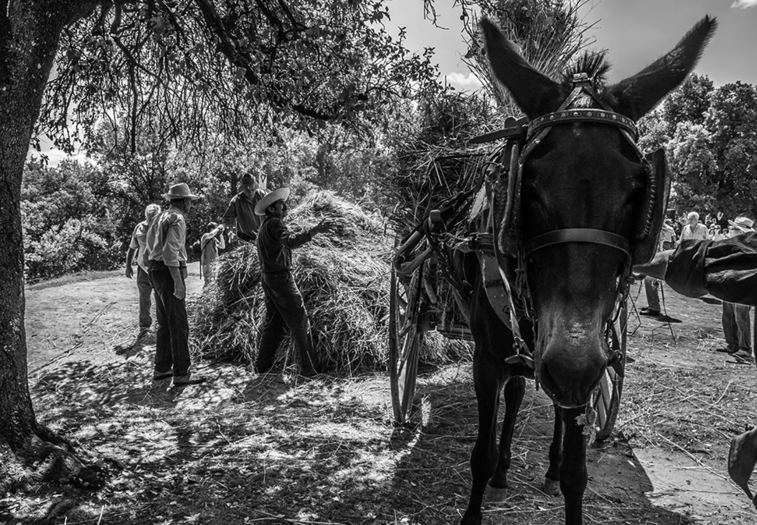
Cavalls, ases i mules han sigut peces fonamental de les tasques agrícoles durant segles (Festa del Segar i el Batre d'Avià).